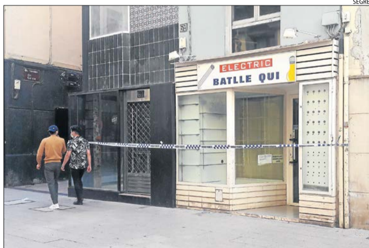
El edificio precintado, con entrada por la Travesía del Carme.